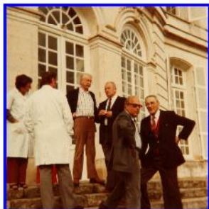
Du Sana au Centre Médical

MEMBRE DU COMITÉ DES FAMILIERS ASSOCIÉS - 21 - LA GUYONNE - 03990 CHALLIGNY Directeur : Philippe, « Service Dentaire FLEURY », Adresse : 141 TERRAIN, 03990 CHALLIGNY Tél. 03 25 41 41 41 - Site Internet : www.sana.fr