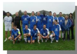
Equipe Fanion 2010-2011